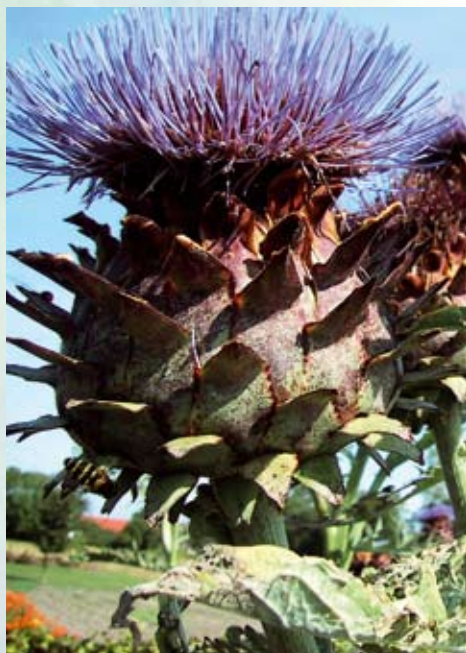
Artiskok ( Cynara ) indholdsstof i "Heparon"

Ved pollenallergi, som også udløser allergi overfor bestemte fødevarer (krydsallergi), hjælper det homøopatiske lægemiddel til høfeber; Høron.