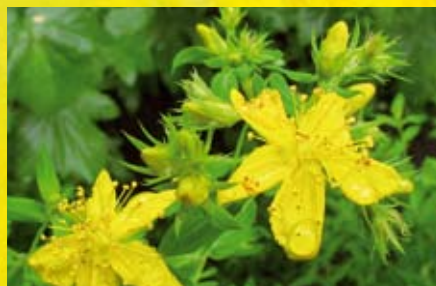
Prikbladet perikon (Hypericum perforatum)

De seneste år er perikon blevet godkendt/ anerkendt som en plante, der kan hjælpe ved depressioner. Perikon har en særlig forbindelse til lyset. I blomstens indre samt i bladene, danner den et lysfølsomt stof; hypericin. Når hypericin kommer i kontakt med lyset, bliver det øjeblikkeligt farvet