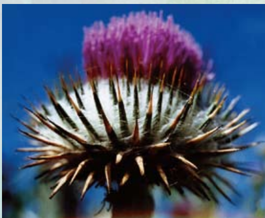
Marietidse (Silybum marianum)– indholdsstof i "Heparon"

cialdyrket og specialfremstillet cikorie, som både styrker nedbrydningen af fødevarer i tarmen, og på den anden side styrker kroppens evne til at opbygge og udnytte næringsstofferne, når disse er kommet ind i blodet.