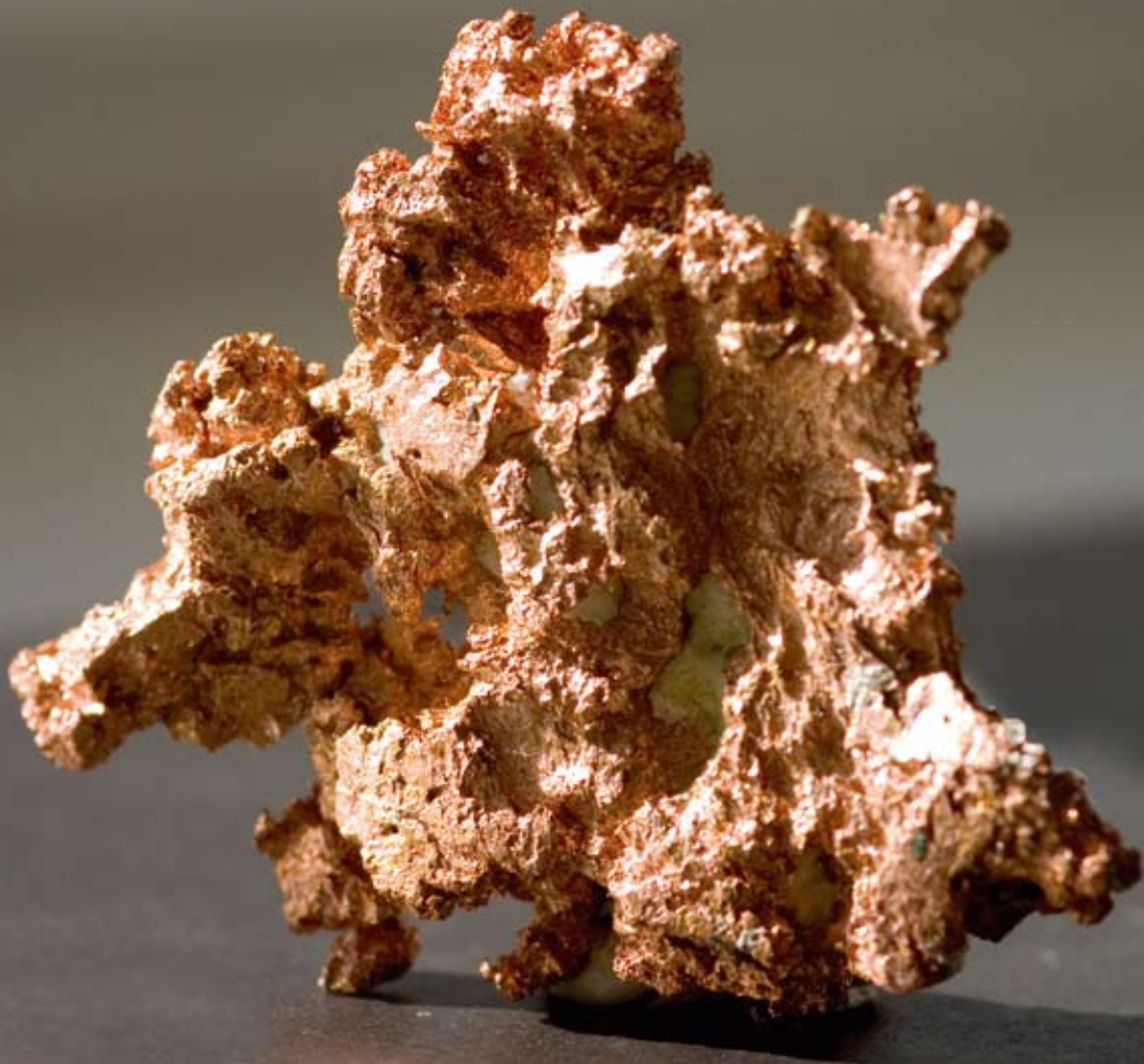
Kobber (Cuprum arsenicosum)