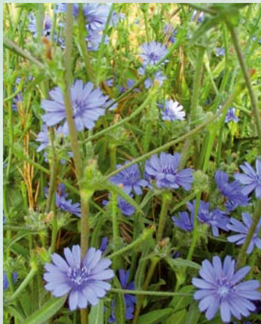
Cichorie (Cichorium intybus)

cialdyrket og specialfremstillet cikorie, som både styrker nedbrydningen af fødevarer i tarmen, og på den anden side styrker kroppens evne til at opbygge og udnytte næringsstofferne, når disse er kommet ind i blodet.