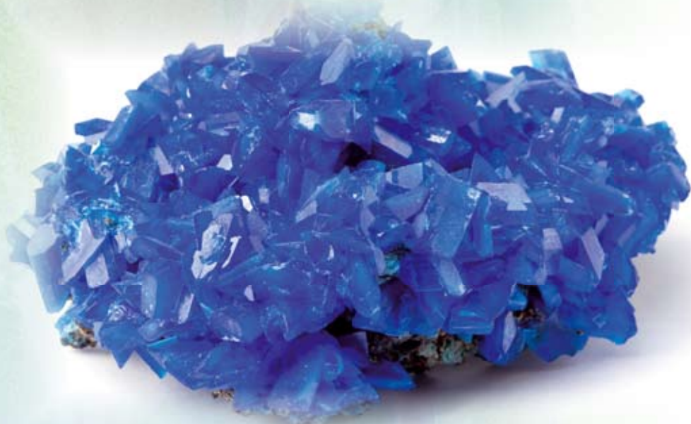
Kobber – Cuprum sulf. krystal

små doser, som de ellers ikke kan tåle. I reglen kan de med tiden bedre tåle det, de ellers var intolerante overfor. De vil dog i reglen støde på en grænse, som de bør holde sig indenfor. Behandlingen kan altså betyde, at de f.eks. godt kan tåle lidt mælkeprodukter, uden at få belastende reaktioner, men i reglen skal de lade være med at begynde at indtage store mængder af mælkeprodukter.